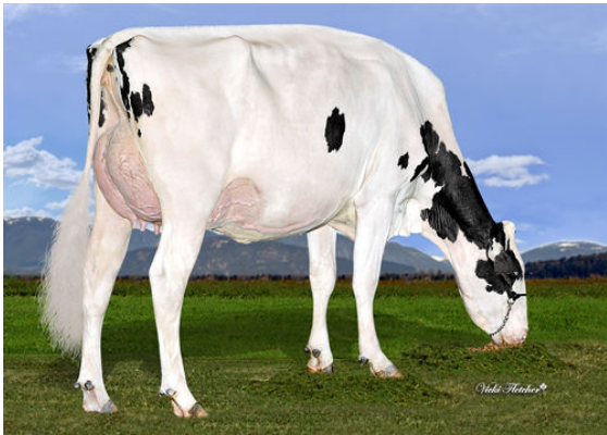
DICKLANDS KING DOC 3503 DAM