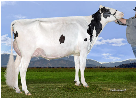
DICKLANDS KING DOC 3503 DAM